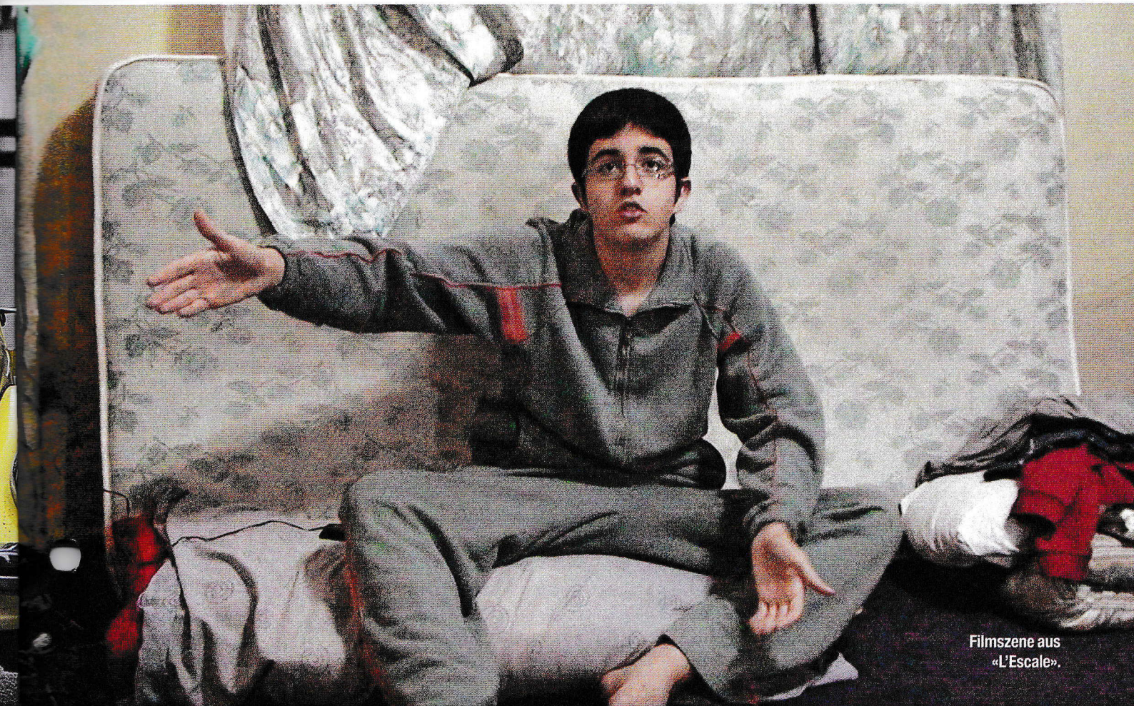
Filmszene aus «L'Escale».